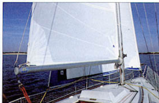
L'avantage d'une bôme à enrouleur est qu'elle permet de conserver une grand-voile lattée.

Intérêt : ★★★★★ Facilité d'util. : ★★★★★ Notice d'util. : ★★★★★ Qualité/prix : ★★★★★ Diffusion : ★★ Distrib. : ACMO France. Prix : 1 100 € (bateaux de 5 à 12 mètres).